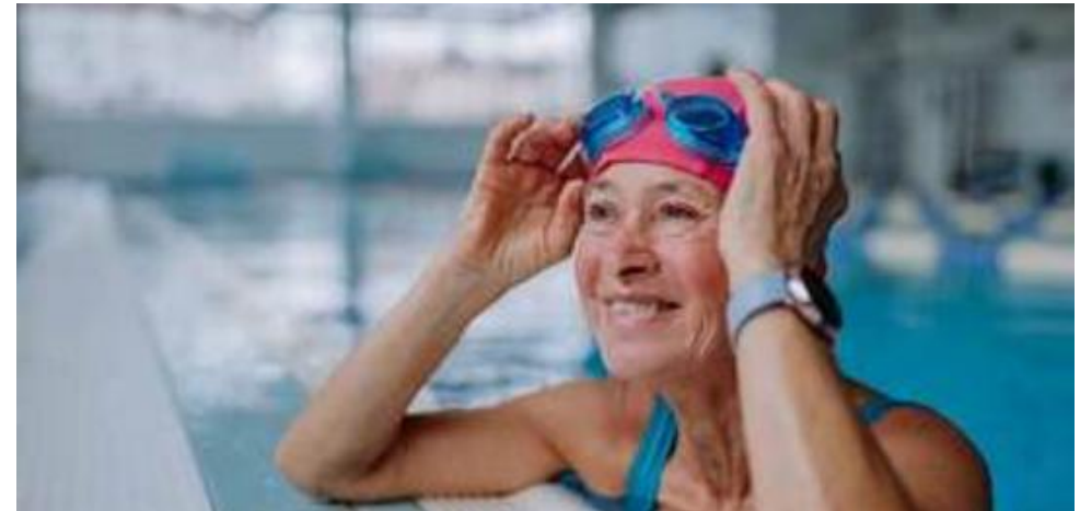
BIENESTRA DE PERSONA MAYOR